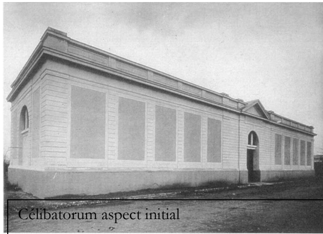
Célibatorium aspect initial

Annoncée pour la fête des Lumières 2007 comme annoncée par la charte de l'anneau bleu, le comité de suivi du Carré de Soie a évoqué le lancement d'une étude du Grand Lyon sur le célibatorium en 2007. Reste à savoir quelle est l'objectif de cette étude - Anneau Bleu ou Carré de Soie - au sein du Grand Lyon ?