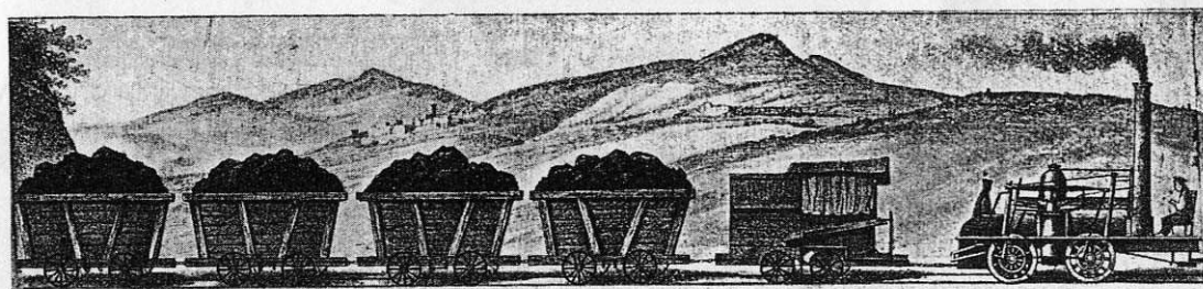
Les premiers trains du chemin de fer de Lyon à Saint-Etienne construit par Marc Séguin. Le train de houille est remorqué par une « Stephenson » perfectionnée par Séguin.

Première ligne ferroviaire, premier film, première usine hydroélectrique au fil de l'eau, premières automobiles, Lyon, en interrogeant son histoire industrielle devrait s'étonner et étonner les autres métropoles par le dynamisme ancien de son industrie ! Cet « emblème » industriel – aujourd'hui ignoré – pourrait être celui de la cohésion comprise au sens d'un bien commun, à la fois social, économique, environnemental – lourd à porter mais incontournable – pour qui veut aborder les nouveaux défis de l'agglomération.